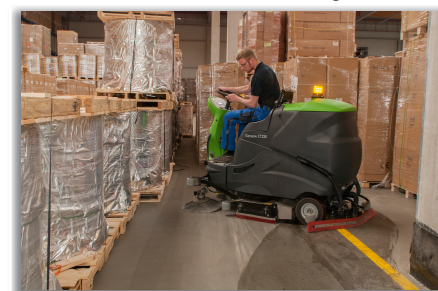
Senator International, Hamburg

CT 230 Sweep Aufsitz-Scheuersaugmaschine mit Wendigkeit und Komfort. www.dialog-portal.info/gansow17