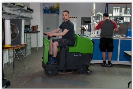
Best Water Inter. GmbH, Beelitz

CT 80 Aufsitz-Scheuersaugmaschine, die mit Osmose Wasser betrieben werden kann. www.dialog-portal.info/gansow16