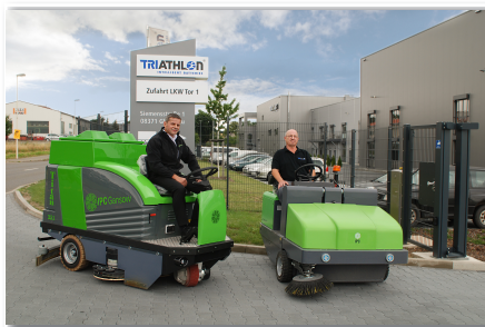
Triathlon Batterien GmbH, Glauchau

ASSM Titan 351 + KSM 161 B Titan serienmäßig mit GWS Ausstattung. 161 B mit Direktkehrprinzip. www.dialog-portal.info/gansow12